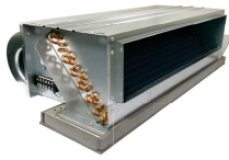
Fan Coil Unit (Standard)