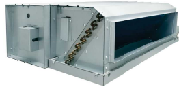
Fan Coil Unit Return Plenum (Option)